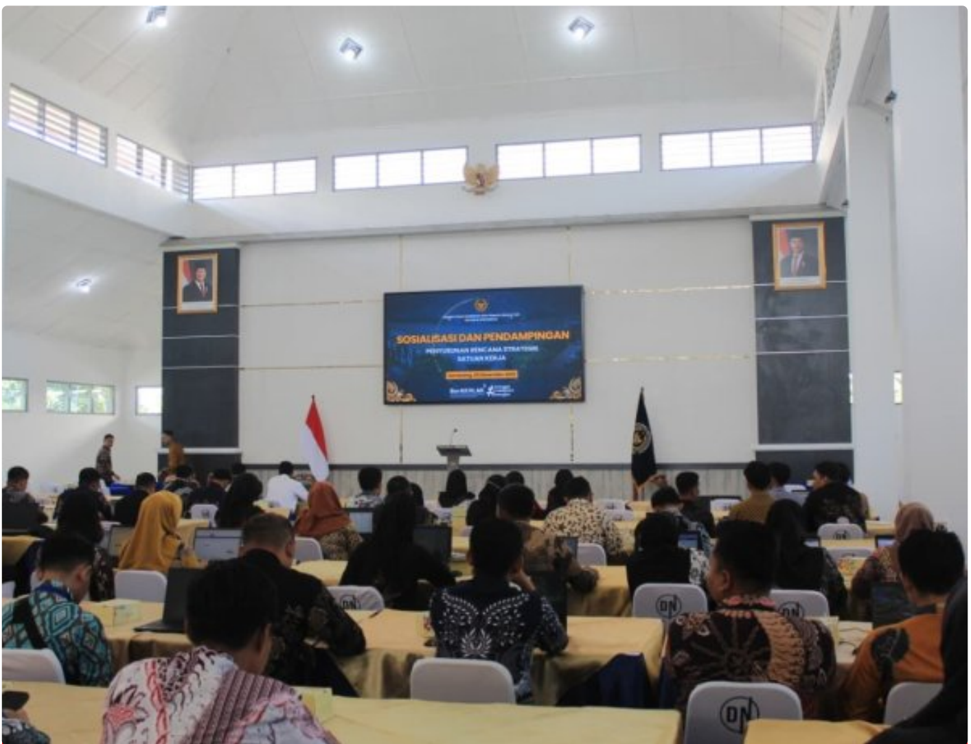
Rutan Wonosobo hadiri Sosialisasi dan Pendampingan Penyusunan Rencana Strategis Satuan Kerja di Lapas Kelas I Semarang

SEMARANG – Rumah Tahanan Negara (Rutan) Kelas IIB Wonosobo menghadiri