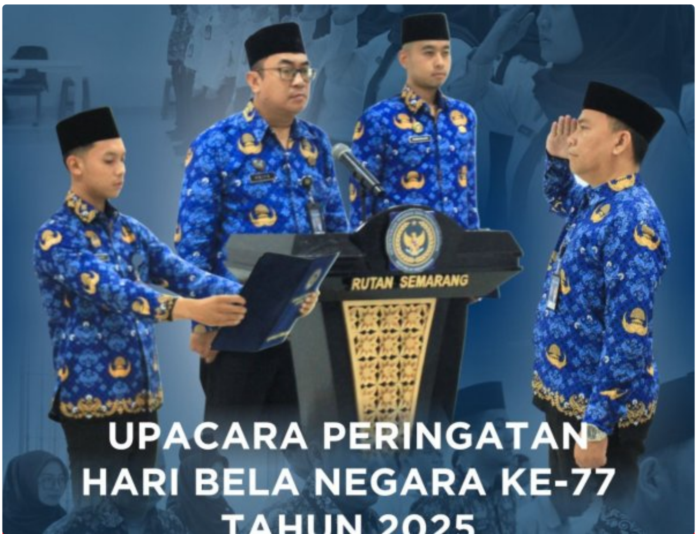
Rutan Kelas I Semarang Gelar Upacara Peringatan Hari Bela Negara ke-77 Tahun 2025

SEMARANG – Dalam rangka memperingati Hari Bela Negara yang ke-77, Rumah Tahanan Negara (Rutan) Kelas I Semarang menyelenggarakan upacara bendera dengan penuh khidmat pada tahun 2025. Kegiatan ini diikuti oleh seluruh jajaran pejabat struktural dan staf di lingkungan Rutan Semarang, Jum'at