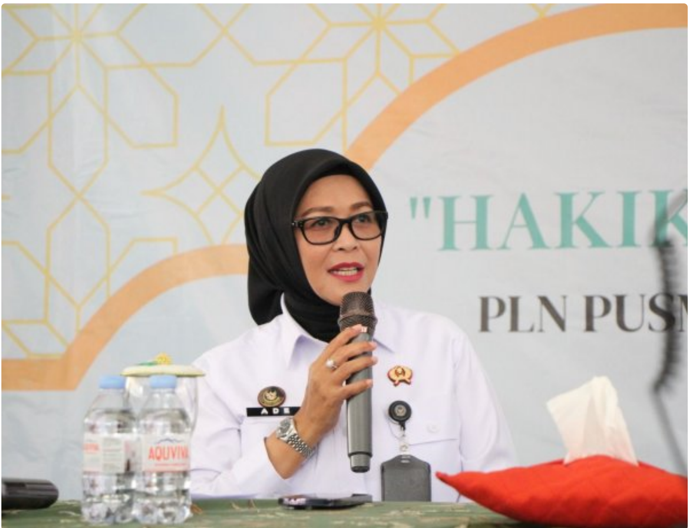
LPP Semarang Bersama PLN Gelar Kajian Keislaman bagi WBP

Semarang -Lembaga Pemasyarakatan Perempuan (LPP) Kelas IIA Semarang bersama dengan PT PLN Pusat Manajemen Proyek (PUSMANPRO) menggelar kajian keislaman yang diikuti oleh seluruh Warga Binaan Pemasyarakatan (WBP). Kegiatan ini dilaksanakan sebagai bagian dari pembinaan kerohanian serta penguatan mental dan spiritual WBP, Selasa (30/12/2025).